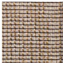
TS_24 Gold trevira wave Rete trevira oro

Абажуры трапециевидной формы из ткани Trevira (цвет на выбор из палитры фабрики), на фото TS_24. Ткань производства DEDAR, трудновоспламеня емая, удовлетворяет актуальным требованиям противопожарных нормативов